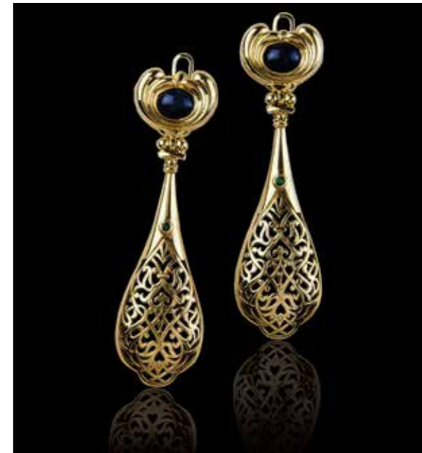
Ill. 9. Arabesque (earrings).

lines of the brooch are like sails filled with warm wind. They are decorated with the Jerusalem cross and the sign of a sad lamb, and the red garnet cabochons resemble congealed droplets of sacrificial blood. The topaz of exquisite marine colour reflects, as in a dome, the evening sky of Ancient Byzantium and the bridge across the strait. The brooch is in thin, as if embroidered, patterns from the clothes of the Roman emperors" [2]. (Fig. 10). If one looks at the plan of the brooch, one can notice that its shape represents the architecture of Hagia Sophia, where pomegranate cabochons are towers. The duality of images is characteristic of the work of Eduard Nikitin, who recreates the impression of a historical event, transferring it to a small sculptural form.