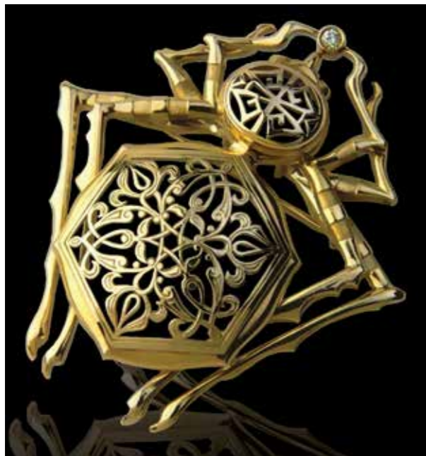
Ill. 5. Spider (a brooch).