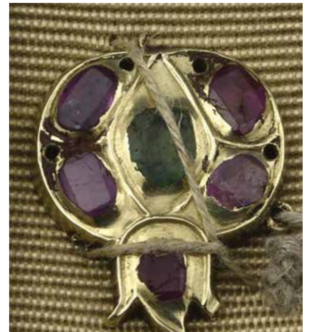
Ill. 4. Cufflink, Constantinople

Another work of Nikitin, a brooch Spider (1996, material: gold, diamonds, Fig. 7), was created in