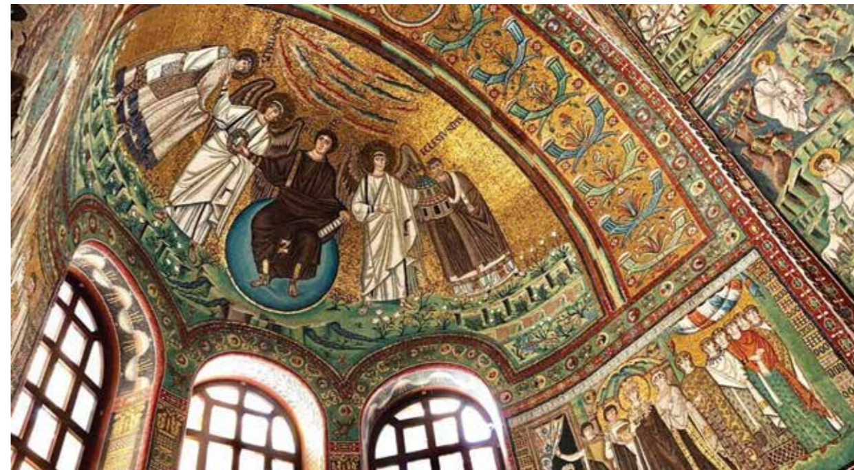
Ill. 1. Basilica of San Vitale in Ravenna, Italy

The artistic language of Byzantine cultural heritage developed in a special social environment, being the style of the capital, the product of a big city, a centralised state church. Documentary sources testify that the art of Constantinople had Hellenism as one of its sources; however, it was not only it. The culture of Byzantium was also formed under the constant influence of provincial regions and