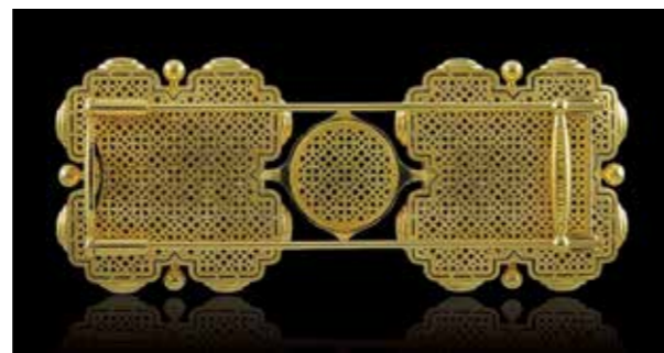
Ill. 7. Byzant of the brooch Evening in Byzantium.