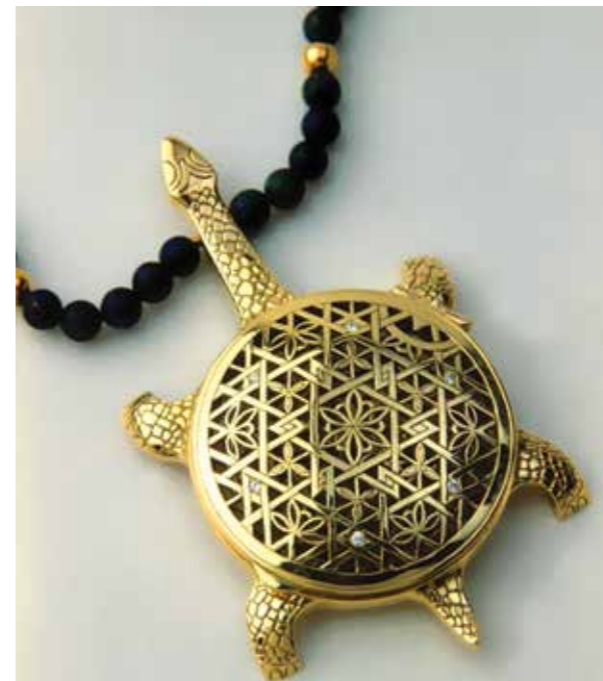
Ill. 3. Universal Turtle (a compass pendant).