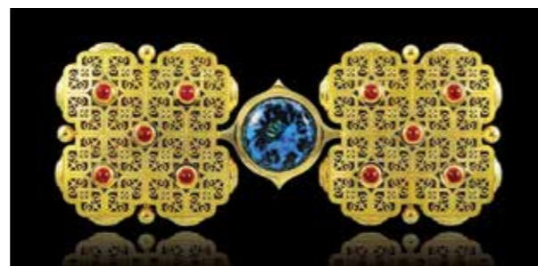
Ill. 6. Evening in Byzantium (a brooch).