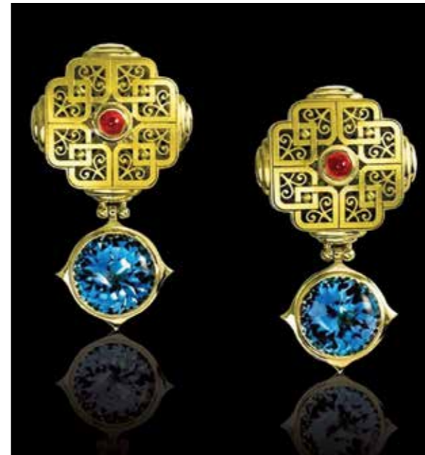
Ill. 8. Evening in Byzantium (earrings).