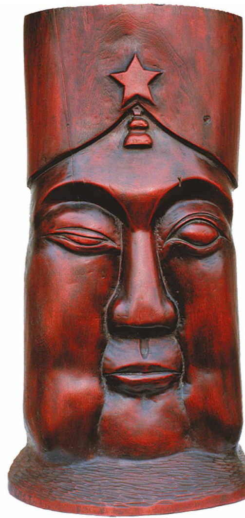
Ill. 2. Wang Keping. 1978. Idol . Height 60 cm. Wood. Personal collection of the artist.

It is worth noting that since the 1920s and 1930s, many sculptors who received education abroad have explored Chinese indigenous cultural and sculptural traditions for inspiration in developing contemporary Chinese sculpture. However, upon examining these artists and their work, it becomes apparent that they also received artistic education within French or Soviet frameworks, or more recently, education focused on contemporary Western art. This allowed them to learn Western plastic methods and scientific principles, which they then applied to the study and development of Chinese sculptural tradition. Therefore, even as they were dealing with the problems of relationship between traditional sculpture and modernity, the preservation of tradition, or “sinification” and “regionalization”, these sculptors still