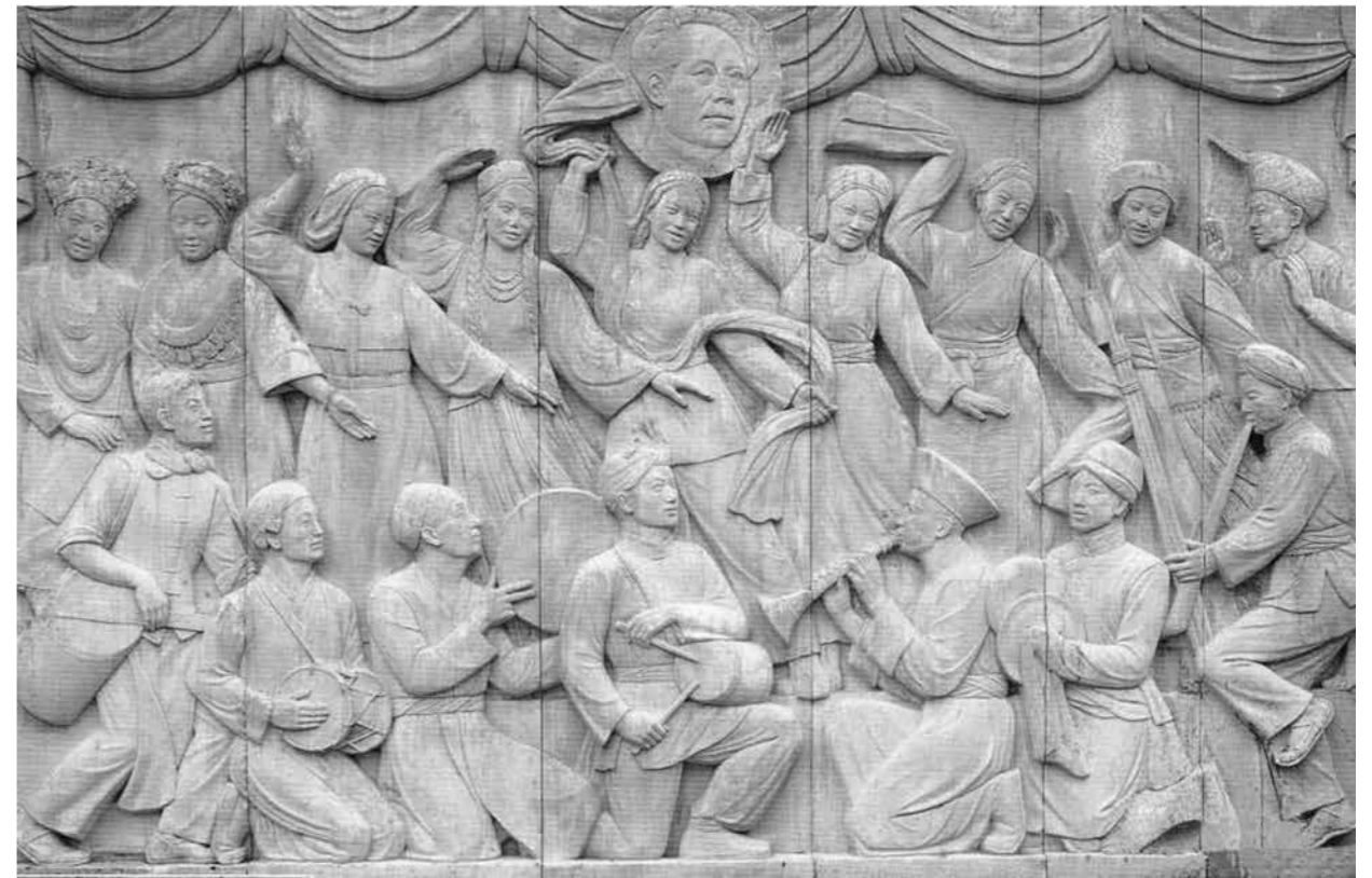
Ill. 3. Wang Linyi. National Unity . Gypsum. 1951 Fine Arts Museum of China Foundation.

Broadly speaking, the plastic art produced in China during the 21st century continues to follow the trajectory established in the final decades of the previous century. This artistic output is characterized by a pluralistic approach and a tendency toward individualism, whether the works in question are small or medium-sized easel sculptures, large outdoor monumental sculptures, or pieces that draw