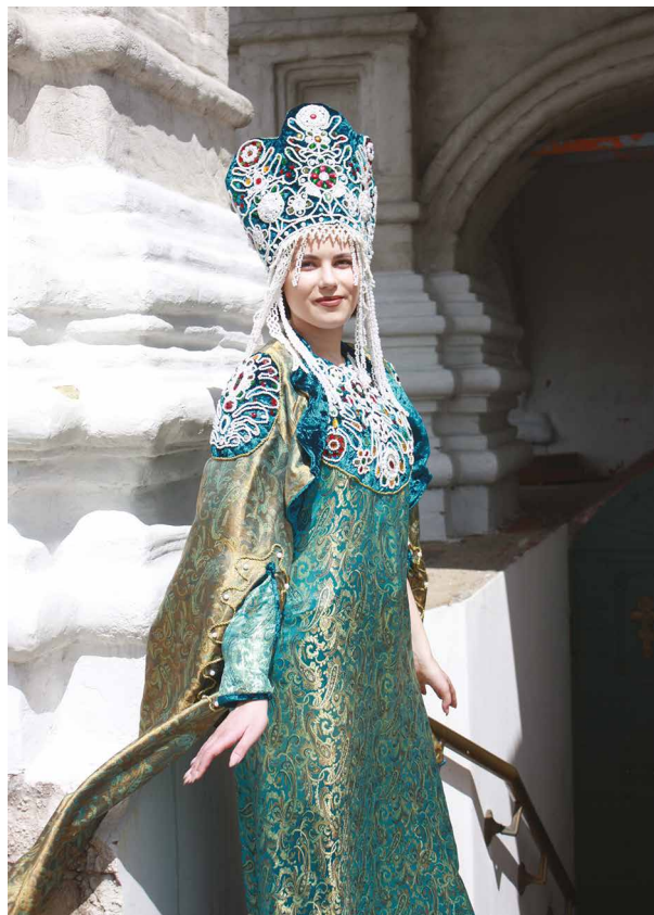
Ill. 5. Collection "Princess". Pearl embroidery.