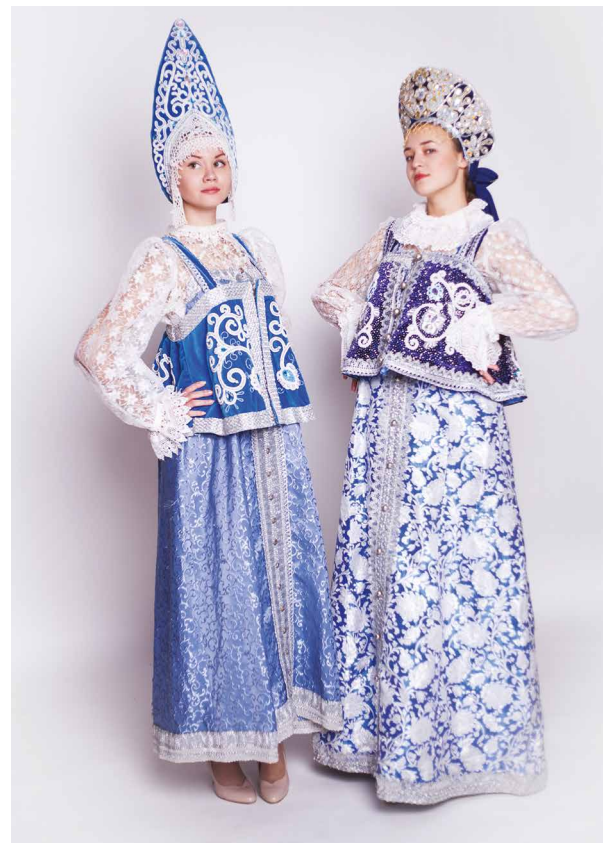
Ill. 6. Collection "Princess". Pearl embroidery.