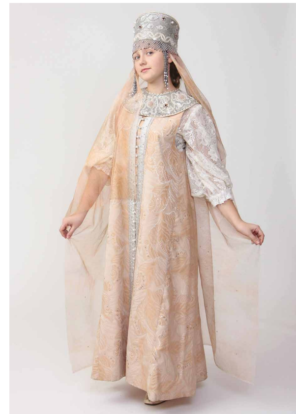
Ill. 7. Collection "Princess". Pearl embroidery.

a spectacular complex, which vividly represents the colours, textures and decors inherent in the traditions of Russian costume. The maestro himself said that he survived only due to his originality and great love for the culture of Russia and owing to his knowledge of the Russian mentality.