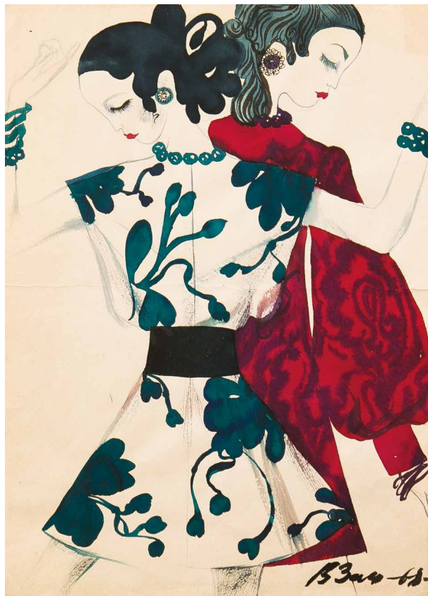
Ill. 2. Vyacheslav Zaitsev. Two girls (in burgundy and green) . 1968. Paper, gouache, mixed media. 33×23,6 cm

Accent and at the same time harmony are the main distinguishing features of Vyacheslav Zaitsev's style. Not decor for the sake of decor, but an idea clearly subordinated to the general concept. At the top, there is a complex artistic image, to which style, silhouette alignment with a slightly high waistline, sculptural form, purity of constructive lines, cut, breathtaking layering, intricate ornamentation, exquisite femininity, material and accessories are subordinate. He created ingenious clothing ensembles, in which everything was consistent with the general idea — beauty for people.