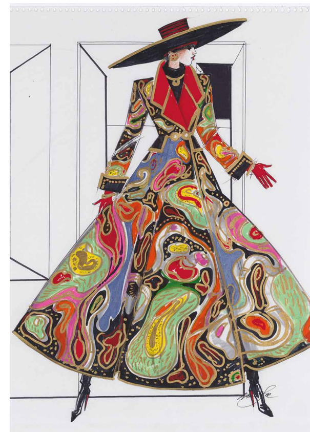
Ill. 4. Vyacheslav Zaitsev. Costume design . 1992. Paper, gouache, mixed media. 43×35 cm

Each new collection of Vyacheslav Zaitsev made a splash. Both Russian and foreign designers were waiting for them. And each collection was a challenge and surprise. No, he never repeated, but kept the style. After many years, it is enough just to look and recognize the unique style. It is impossible to imagine that someone can repeat the masterpieces of Vyacheslav Zaitsev. Constant work, search, sketches — all this is everyday work. Quality control, compliance with the initial sketches, materi-