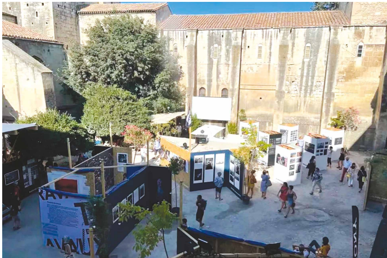
Ill. 1. 53 rd International Festival of Photography in Arles (France), 2022.

ters to continue to live on. Furthermore, the 2022 festival, for the first time, explored the new “image of a woman” in artworks through five themes focusing on exposing gender discrimination, social injustice, and patriarchy. Another example or “new reading” of the classics is “PHOTOFAIRS New York”, the event that occasionally reinterprets and revisits, for instance, social documentary or war photography from the early 20th century.