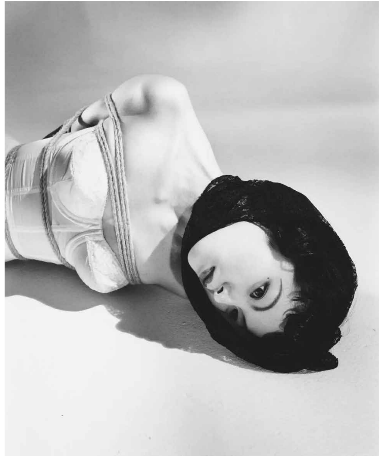
Ill. 3. Nobuyoshi Araki. 1989. Untitled . 38 x 47.7 cm

techniques to recreate his own body, replacing the race, gender and sexuality of models. His acclaimed Actress series examines 20th-century cinema as a cultural marker capable of reflecting the development of modern society and civilization. Women, movie stars, whom Morimura calls "symbols of the 20th century", are the most striking images from