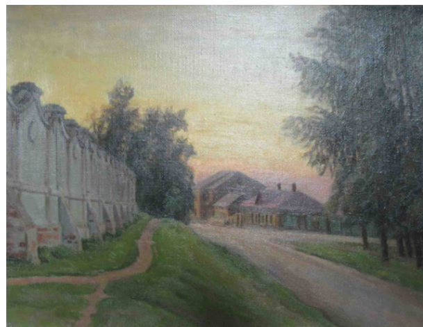
Ill. 21. Alexander Klyuev Old Town (1994). Oil on canvas 38×50 cm. 45×43 cm.

В 2011 году было создано первое академическое учреждение в Китае, занимающееся продвижением художественных проектов между Россией и Китаем с направлением изучения искусства живописи – Хэйлунцзянская организация по обмену и изучению искусства живописи в России, председателем которой стал Чэнь Фэньюэ. В сотрудничестве с Народным художником Российской Федерации В.П. Дроздовым и председателем Хабаровского отделения Союза художников России Н.И. Вагиным в качестве консультантов он издавал единственный на тот момент в Китае русско-китайский двуязычный журнал по живописи «Русско-китайская современная живопись» (рис. 4).