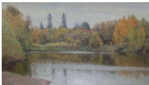
Ill. 22. Alexander Klyuev Autumn in Kemchik (1994). Oil on canvas 25×45 cm. 45×43 cm.

За последние несколько лет Чэнь Фэньюэ и его команда принимали более 200 российских художников в Харбине в рамках творческих обменов. Кроме того, он установил долгосрочные отношения сотрудничества с Москвой, Санкт-Петербургом и Академией художеств имени Ильи Репина в России, а также отредактировал и опубликовал десять томов двуязычной серии «Современные художники России» и «Современные графики России» (рис. 5).