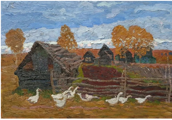
Ill. 11. The Tkachev brothers Autumn (1974). Oil on canvas 30x50 cm. canvas 60x50 cm.

daohezi (Heilongjiang Province) to create and exchange experiences (Ill. 6, 7).