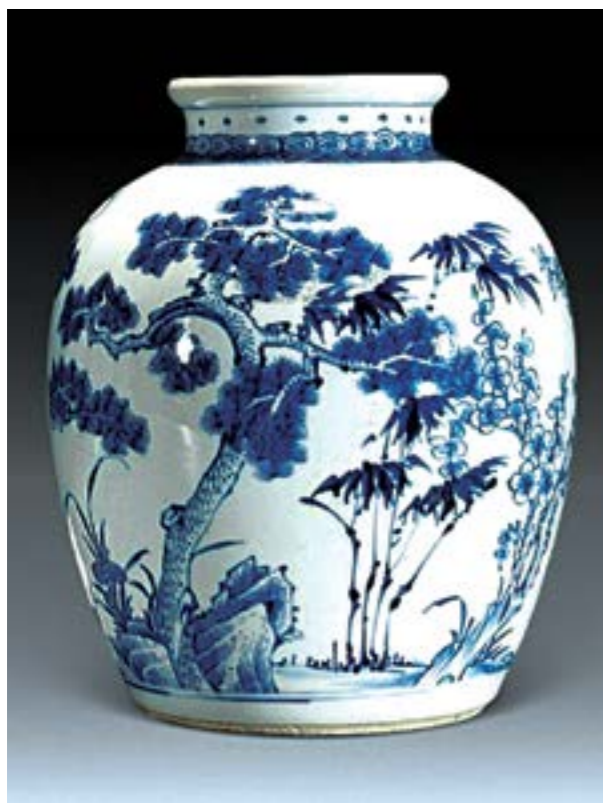
Ill.4. Qing Dynasty. Porcelain decoration, The Three Friends of Winter.

is best represented by works from the Chenhua period (1464-1487), reign of Emperor Chenhua, Ming Dynasty) and the Wanli period (1572-1620, reign of Emperor Wanli, Ming Dynasty), in which decorative motifs of the late 15 th century have very fine lines and a two-line inking and colour fill method were