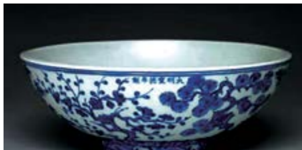
Ill.3. Yuan Dynasty. Porcelain decoration, The Three Friends of Winter.

is best represented by works from the Chenhua period (1464-1487), reign of Emperor Chenhua, Ming Dynasty) and the Wanli period (1572-1620, reign of Emperor Wanli, Ming Dynasty), in which decorative motifs of the late 15 th century have very fine lines and a two-line inking and colour fill method were