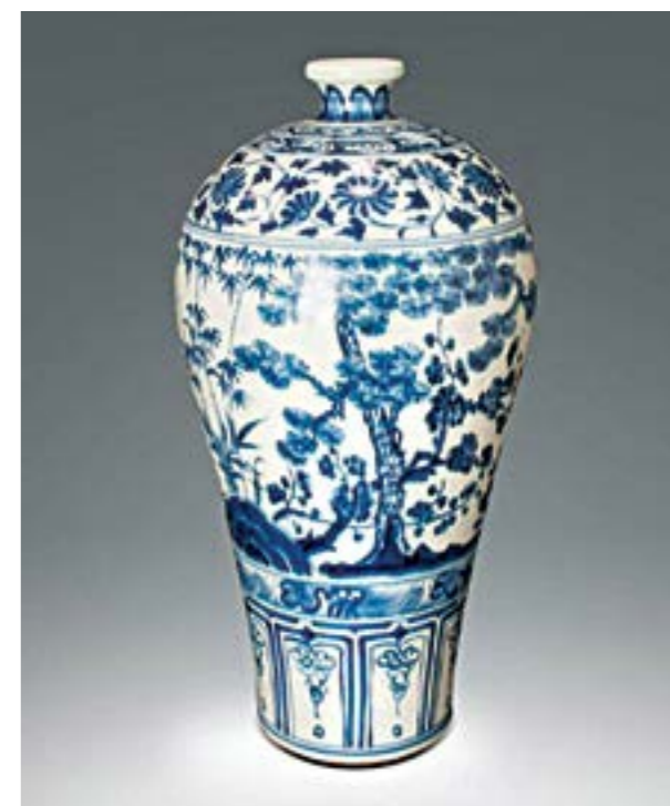
Ill.2. Yuan Dynasty. Porcelain decoration, The Three Friends of Winter.

The Three Friends of Winter motif was popular on the Ming-era Qing Hua Ci porcelain (ill.3). At the same time, the porcelain of early and middle Ming is quite different. The early Ming Dynasty is best represented by the Hongwu period (1368-1398, reign of the Hongwu Emperor of the Ming Dynasty) and the Yongle period (1402-1424, reign of the Yongle Emperor, Ming Dynasty), which feature 14 th -century decorative motifs generally characteristic of the Yuan Dynasty; however, the patterns are more concise and not burdened with unnecessary details. The pine tree is the main object in the composition; the needles on the branches of the pine trees were drawn more densely, sometimes depicted in bunches. Plum blossoms are arranged in an orderly manner and are often blurred. The touching contours of all flowers are a distinctive feature of the image of plum flowers. By the beginning of the 15 th century, there was a desire for greater simplicity and naturalness in the decorative patterns of porcelain. Thus, pine branches were drawn thinner, and needles were drawn in bunches. The bamboo stems were also drawn very delicately. Plum flowers on branches that were drawn sparse and small looked very elegant on porcelain of this period. The mid- and late-Ming Dynasty