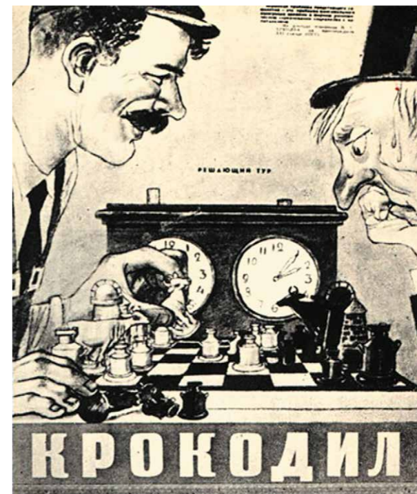
Ill.2. M.M. Cheremnykh (1890–1962). "The Decisive Round". "Crocodile", 1959

The satirical drawing "The Decisive Round" of 1959 on the theme of competition between the USSR and the USA in the development of agriculture by M. Cheremnykh in "Krokodil" presented the revelation of the image of a working man (the figure on the left). This is a profile image of a middle-aged man with a dark mustache, wearing a shirt