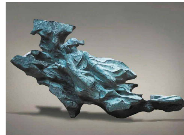
Ill. 3. Deng Ke. Deng Ke. A Long Way to Go . Bronze. 2023.

wood as a material. The geometric shapes of the figures are skillfully combined with the wood texture and muscle lines of the figures, so that the natural wood pattern becomes an important part of the artistic expression of the work.