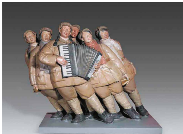
Ill. 1. Sun Yan. Singing Together . Fiberglass. 2023

figures are presented to the audience through subtle sculptural techniques, allowing the authors to build a spiritual bridge between the past and the present. For example, Sun Yan's work "Singing Along" focuses on female soldiers from the Anti-Japanese War of Resistance period. The subtle and realistic approach to work allowed the author to depict in great detail the youthful faces, determined looks, and authoritative body language of the female soldiers. Dressed in simple military uniforms, they are depicted standing on stage and singing in unison. The work is nostalgic, as it takes the viewer back to that turbulent, warring, yet passionate era. This is not just a reproduction of a historical scene, but a recreation of the spirit of a bygone era in a modern context and, thus, an exploration and inheritance of history. It makes us deeply comprehend how at a critical moment of great danger to the nation, artists and writers use art as a weapon to unite people, raise morale, and give strength and hope.