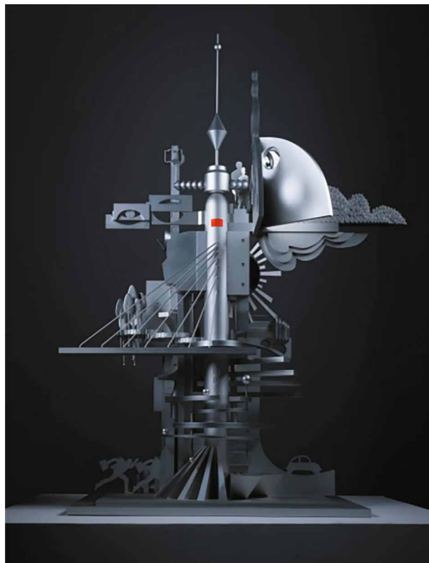
Ill. 4. Tang Yong. Monument to Time . Aluminum alloy. 2024

etc., are gaining an increasingly wider range of applications in the creation of contemporary sculpture, which opens up unprecedented opportunities for innovation. "Materials and the ways of their use have always been the most important means of realizing the artistic effect of sculpture. The novelty of the artwork's creation is an important means to stand out, therefore breaking through the already established empirical material system of the artwork is an important strategy to obtain new modes of artistic expression." 4 With its modern metallic sheen, high strength and corrosion resistance, stainless steel has become the ideal choice for many sculptors to express contemporary themes and innovative ideas. For example, all the advantages of the new material are explored in Liu Zheng's "And three million jade dragons ascended into the air, To the universe they brought frosty days." 5 The theme of the work is winter sports, through smooth lines and dynamic modeling the author created vivid athletic images of winter sports athletes and conveyed a sense of speed. Also Tang Yong's "Monument to Time", in which stainless steel and mechanical details are used by the author to show the launching